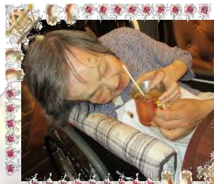
コメダ珈琲でお茶time