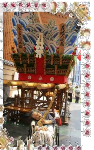
山笠をバックにパチリ