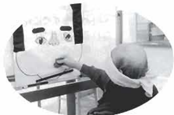
下、下！もう少し右！ なかなかの腕前かも！