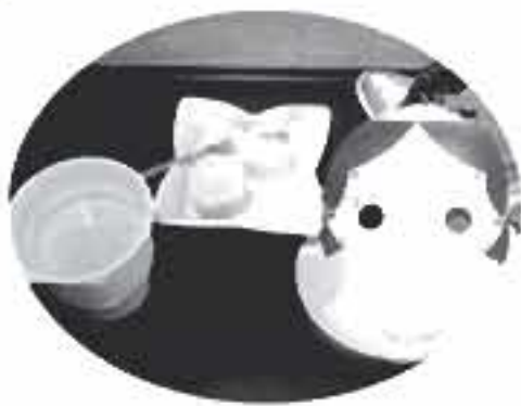
おいしいお菓子をいただきました