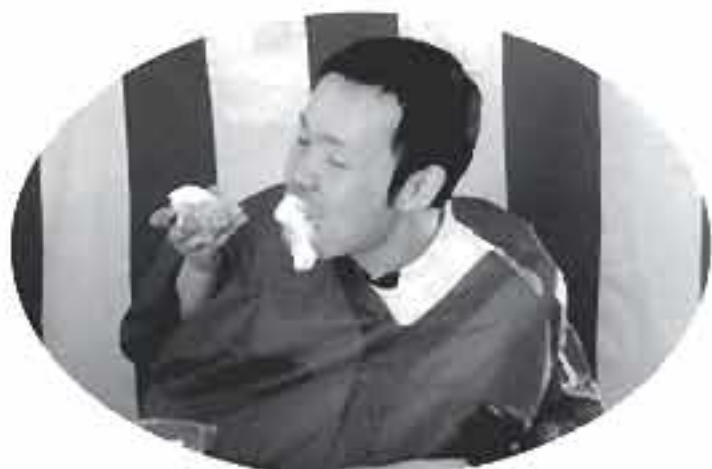
あっもうちょっと少なめをお願いします...

今年の新年会は各フロア思考をこらした催し物が盛りだくさんで開催されました！ 「福笑い」「もちつき」「二人羽織り」「おみくじ」「絵馬」などなど☆☆☆ 昼食は、みなでお鍋を囲んで楽しい一日を過ごしました。 今年も皆様のご健康をお祈りして、来年も楽しい新年会を迎えられますように・・・ 職員一同願いをこめて・・・★