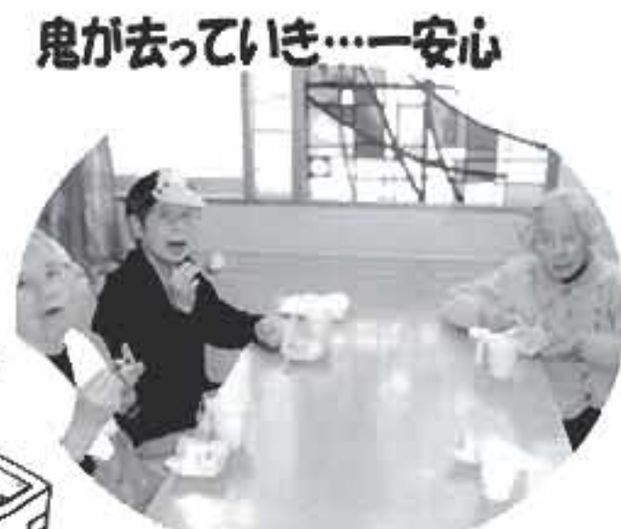
鬼が去っていき……安心