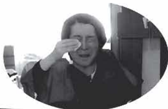
なかなかメイク上手ねえ～