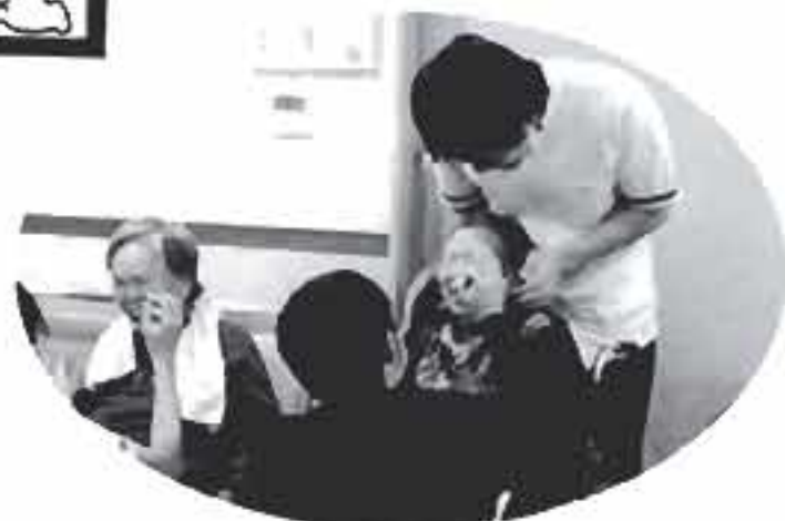
きゃあ～美人にしてよ！ 後で仕返ししてやる～