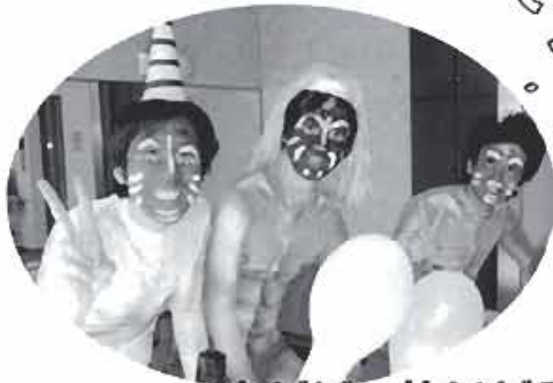
鬼だぞー怖いだろお