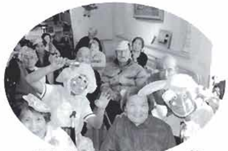
みんなでやっつけるよー!!